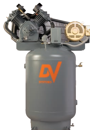
10cv et 15cv - Réservoir d'air comprimé vertical de 120 gal.

“V” DV Systems – Les compresseurs à 4 cylindres sont un design de pompe classique éprouvé par plusieurs décennies d'utilisation de fonctions allant de réparation automobile jusqu'à une production industrielle exigeante. La faible vitesse combinée avec l'excellente réfrigération de ces unités crée un compresseur imparable. Le débit d'air élevée combinée avec l'entretien facile, le design robuste et l'opération efficace font de ces compresseurs une valeur sûre.