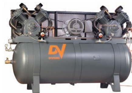
25cv et 30cv - Réservoir d'air comprimé de 240 gal.