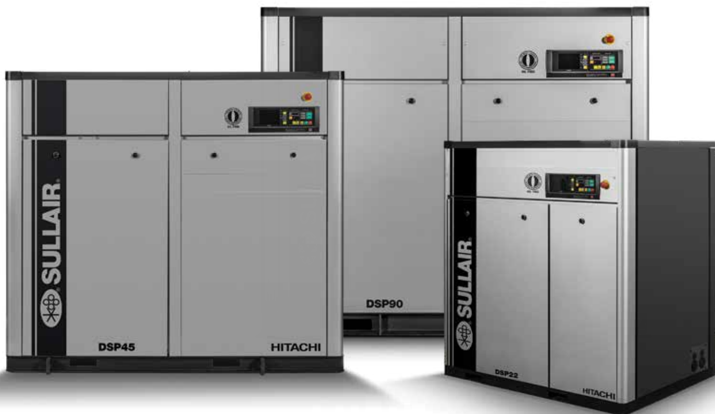
PRÉSENTATION DES PRODUITS À VIS SÈCHE À DEUX ÉTAGES

La série DSP apporte un fonctionnement évolué sans huile exactement là où vous en avez besoin : dans votre usine! S'appuyant sur la technologie Hitachi, le DSP est conçu pour fournir de l'air sans huile de façon aussi fiable qu'efficace, aujourd'hui comme demain.